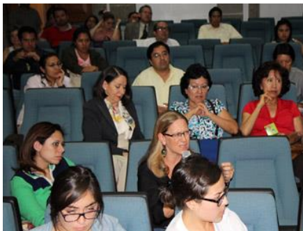
Público en el Palacio de Minería.