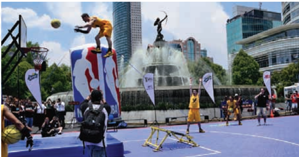
Jam Festival, espectáculo internacional de baloncesto realizado sobre el Paseo de la Reforma

Además, se logró un impacto publicitario de 11 millones de dólares por concepto de promoción de imagen por medio de videos, fotografías, internet y crónicas que transmitieron los medios internacionales sobre la capital del país y que se obtuvieron de forma gratuita gracias a la realización de este evento.