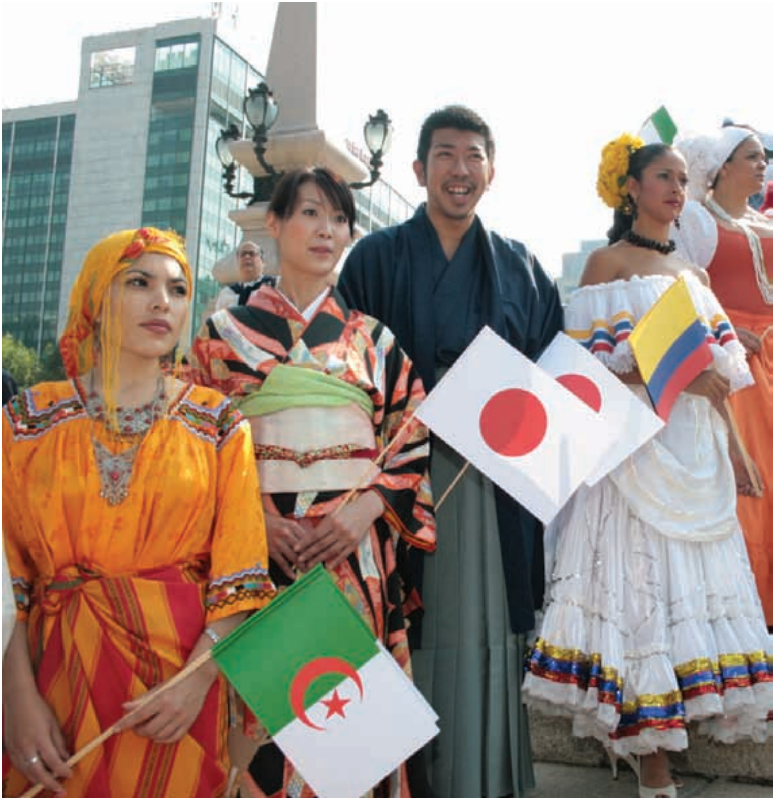
Ferias de las Culturas Amigas, 2009