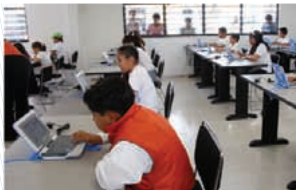
Programa de aulas digitales

México: ciudad saludable, ciudad sostenible y ciudad con conectividad y tecnología.