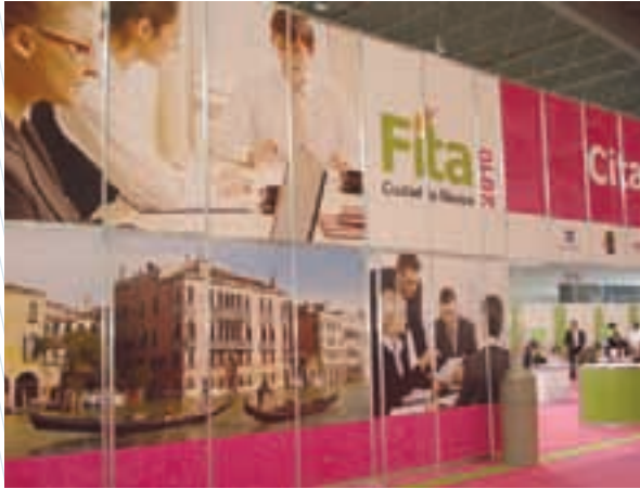
Feria Internacional de Turismo de las Américas (FITA)

En promedio, 11 millones de turistas visitan la Ciudad de México anualmente, de los cuales 2.3 millones son extranjeros.