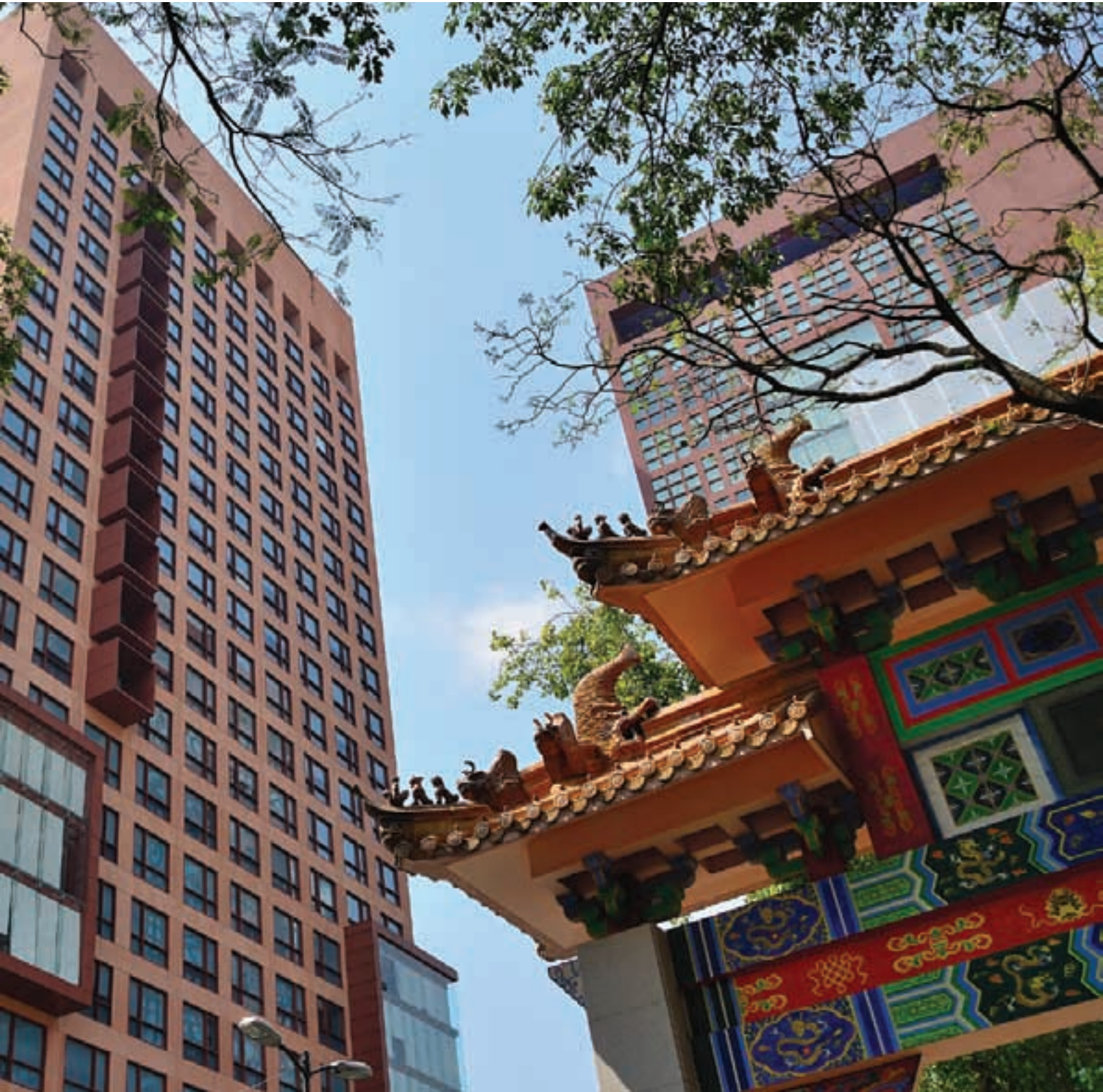
La Secretaría de Relaciones Exteriores y el Arco chino