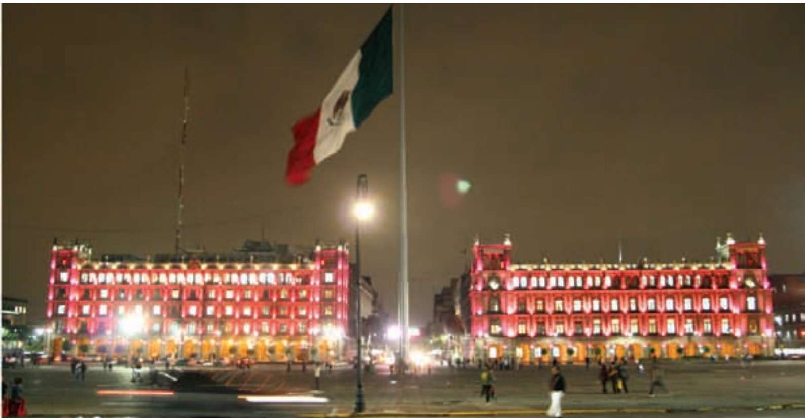
Sede del Gobierno de la Ciudad de México, en el Zócalo capitalino