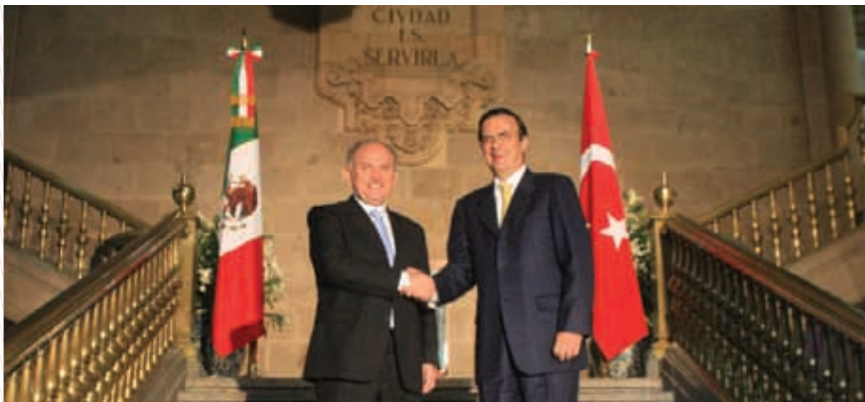
Kadir Topbas y Marcelo Ebrard Casaubon firman el hermanamiento entre el Municipio Metropolitano de Estambul, Turquía y la Ciudad de México, 2010

manera, Seúl invitó al Gobierno de la Ciudad de México a participar en el Programa de Adiestramiento de Funcionarios 2011 (Training Program 2011) en materia de transporte urbano. En mayo de 2011, la Ciudad de México participó en la Feria de la Amistad de Seúl junto con 50 países y ciudades del mundo entero que se dieron cita en la capital coreana para mostrar algunos elementos de su cultura y gastronomía.