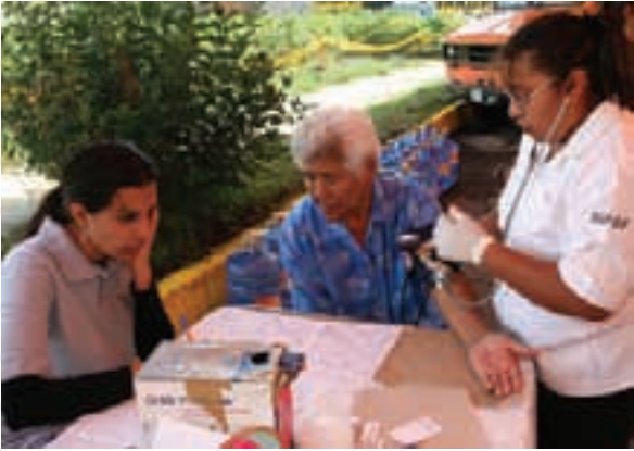
Red Ángel: ejemplo mundial de política integral de protección social