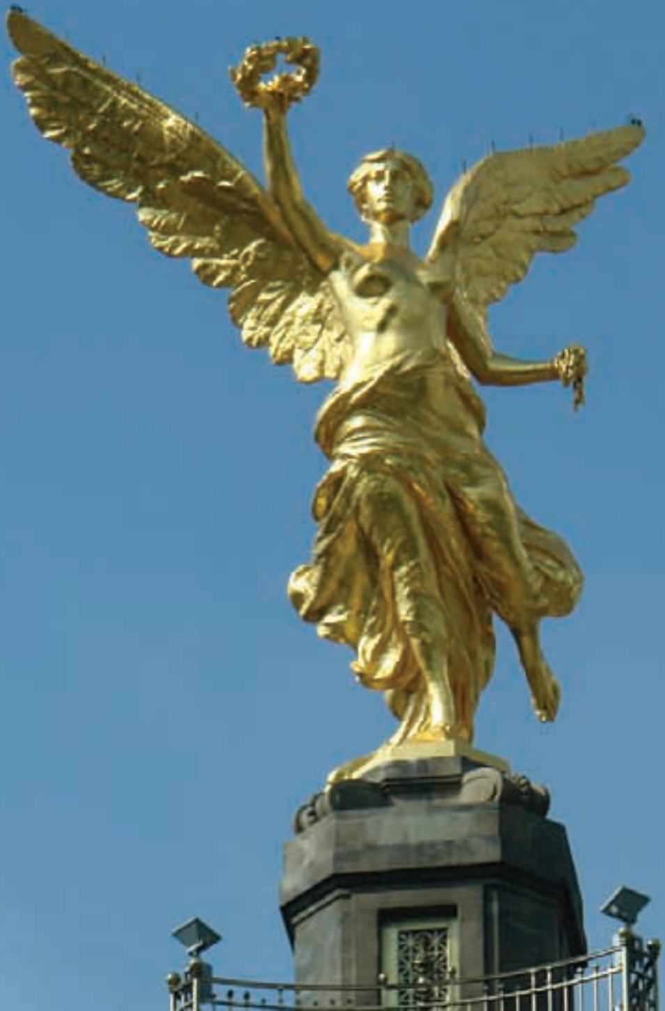
Ángel de la Independencia, Paseo de la Reforma