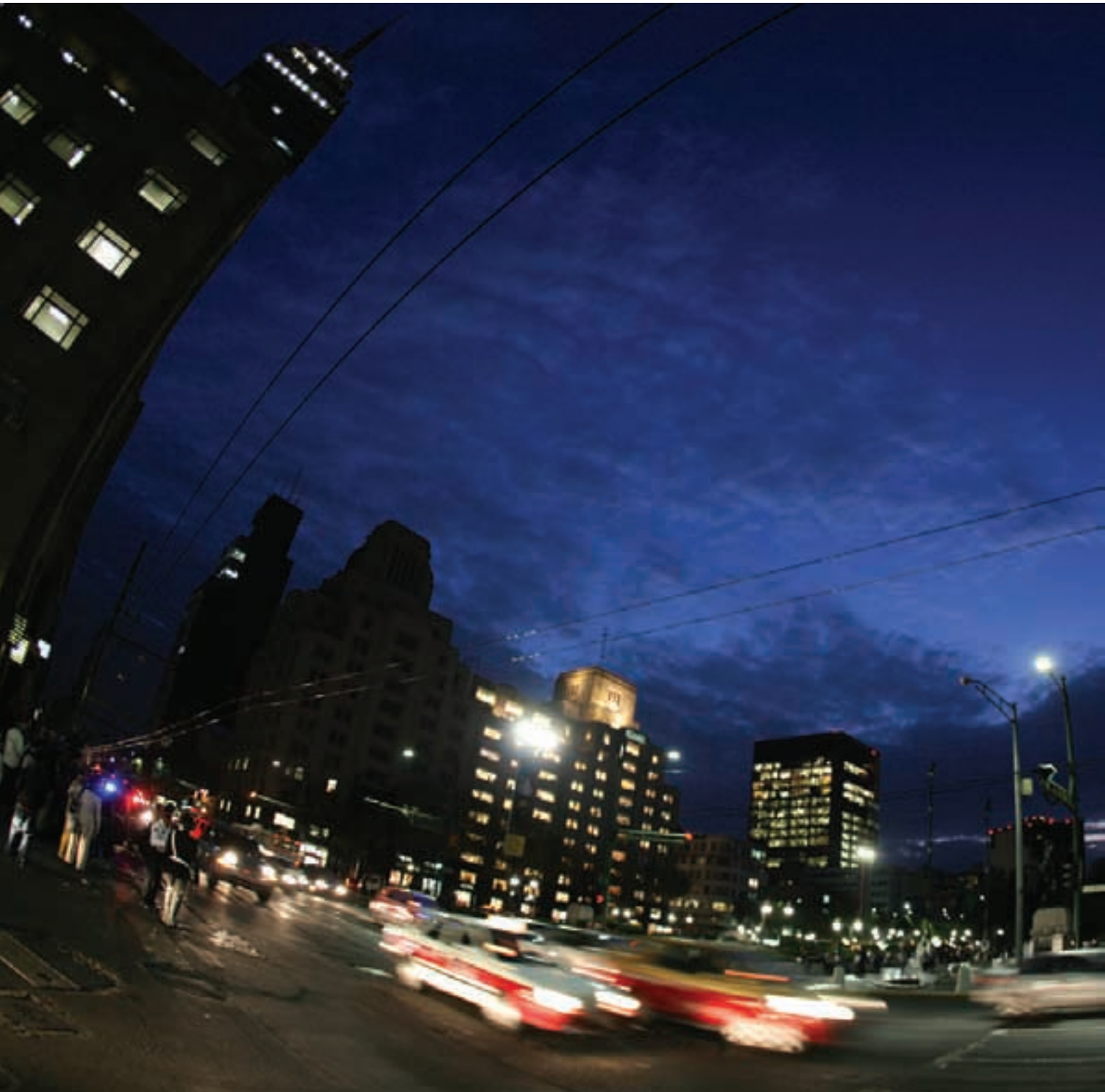
Corredor Eje Central "Lázaro Cárdenas" Centro Histórico