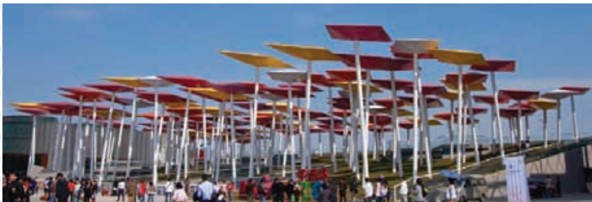
Pabellón de México en la Expo Shanghái

tuvieron la oportunidad de realizar más de 25 mil citas de negocios con más de 3 mil expositores. El evento dio lugar a la institucionalización del llamado FITA Congress , sistema de rondas de negocios para todos aquellos interesados en congresos y convenciones.