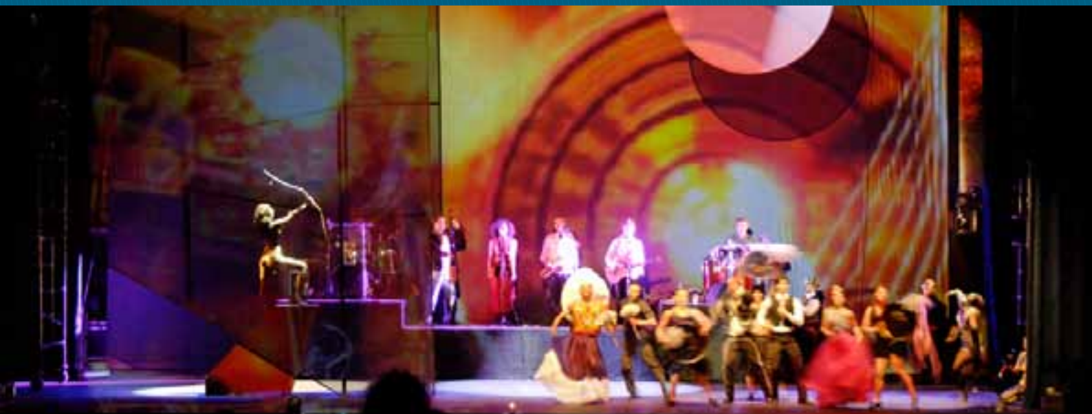
“Ciudad de México, Ciudad con Ángel”, Colectivo Antártica

▶ Gracias a su oferta cultural, sus dinanismos económico y tecnológico, su infraestructura y su capital humano, la Ciudad de México es un lugar propicio para las artes, el turismo y la inversión. Con el apoyo de socios internacionales y una responsable vinculación con el exterior, el impulso a cada uno de estos temas ha sido notorio, lo que ha traído como resultado una renovada presencia y visibilidad internacional para la ciudad y sus ciudadanos.