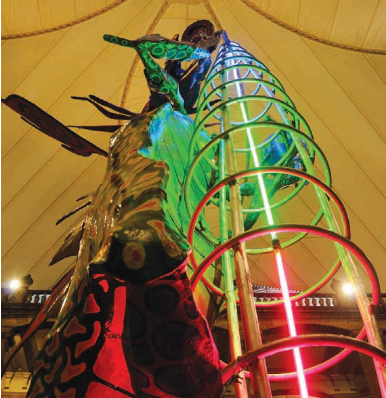
“Espiral evolutivo”, obra del colectivo Oruborus , Faro de Oriente, Pieza central del Palacio de Minería.