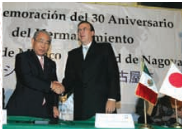
Commemoración del 30 aniversario Ciudad de México-Nagoya

La Ciudad de México tiene convenios de hermanamiento y amistad con siete gobiernos locales europeos: en Madrid, Cádiz y Barcelona, en España; Berlín, Alemania; París, en Francia; Kiev, en Ucrania; y la Región de Valonia, en Bélgica. Destaca el hermanamiento con la ciudad de Madrid, firmado en 1983. Recientemente