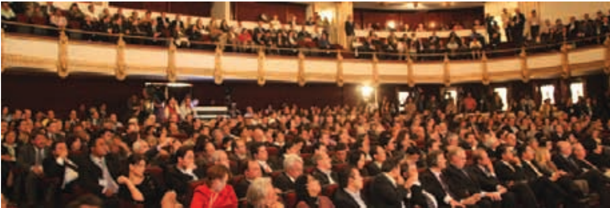
Ceremonia inaugural del Tercer Congreso Mundial de CGLU, en el Teatro Metropolitan