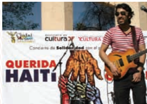
“Hoy por Haití, mañana por tí”, conciertos para coleccionar fondos para las víctimas del terremoto en Haití, 2010

Asimismo, en marzo 2011, un terremoto en Japón de magnitud 9 provocó un tsunami que causó graves daños a la población. El mismo día en que se presentó la contingencia, elementos de la Secretaría de Protección Civil de la Ciudad de México partieron al país asiático a realizar labores de rescate. En total se enviaron 20 especialistas, además de 10 binomios hombre-perro, que unieron esfuerzos con otros grupos internacionales de rescatistas. Debe resaltarse que desde agosto de 2010,