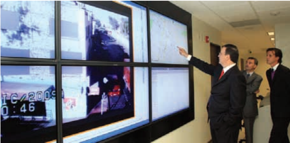
El Jefe de Gobierno muestra la tecnología de seguridad de la Ciudad de México a visitantes extranjeros

Desde 2010, el Instituto Técnico de Formación Policial de la Ciudad de México gestiona con las embajadas de Canadá, Alemania, Argentina, Brasil, Colombia, Chile, Ecuador, España, Estados Unidos, Francia, Israel, Italia, Japón y China una serie de intercambios académicos para los cadetes de policía de la Ciudad de México con las agencias policiales de estos países. Lo mismo ocurre en la capacitación de alto nivel en distintos temas de seguridad, tales como manejo de explosivos y control de flujos en transportes colectivos, entre otros. Destaca la colaboración con la Policía Metropolitana de Los Ángeles, en materia de mecanismos defensivos y ofensivos para policías en bicicleta.