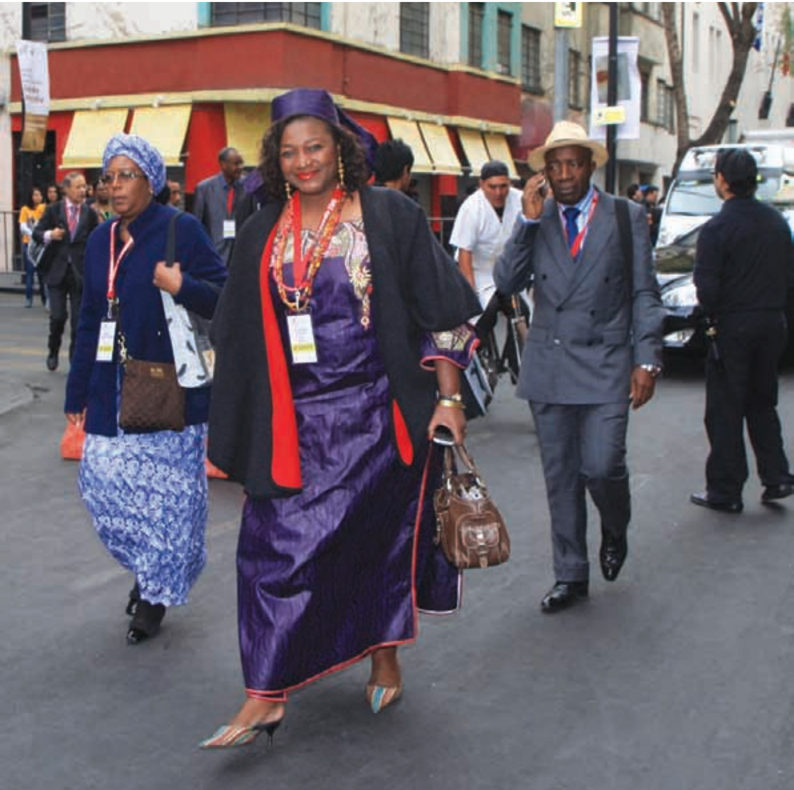
Alcaldes del mundo en la Ciudad de México en el marco del Tercer Congreso Mundial de CGLU