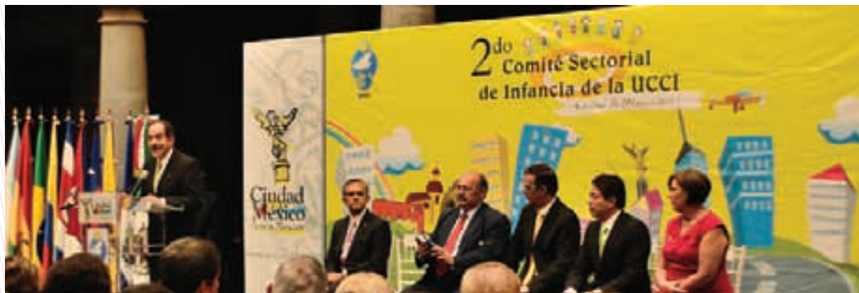
Evento de la Unión de Ciudades Capitales Iberoamericanas (UCCI), 2011

más de 70 países y representan a más de 500 millones de personas. Esta asociación ofrece servicios de consultoría técnica, capacitación y apoyo en la aplicación de esquemas de desarrollo sostenible a nivel local. Desde 2009, la titular de la Secretaría de Medio Ambiente de la Ciudad de México ocupa la Vicepresidencia mundial de esta asociación, con lo que se ha logrado entablar diálogo directo con ciudades y organismos internacionales enfocados al cuidado del medio ambiente.