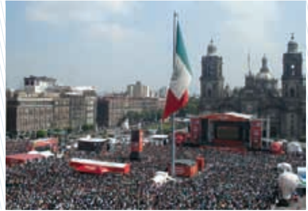
FIFA-Fan Fest, la fiesta del futbol en el Zócalo capitalino

El Maratón de la Ciudad de México pasa por las principales vialidades de la capital y cubre un total de 42 mil 195 metros, ruta que está certificada por la Asociación Internacional de Maratones y Carreras de Ruta y la Asociación Internacional de Federaciones de Atletismo. En sus ediciones de 2007, 2008 y 2010 participaron 200 corredores extranjeros de países tan variados como Kenia, Brasil, Bolivia, Tanzania, Etiopía, España o Guatemala. Hillary Kimaiyo, maratonista de Kenia, se adjudicó el primer lugar en las carreras de 2007 y 2010. En 2011, Kenia volvió a ganar. El primer lugar lo obtuvo Isaac Kimaiyo, seguido de Hilary Kipchirchir y Philip Metto.