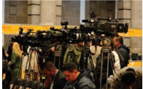
Cobertura de prensa

Cobertura de la Cumbre en medios 152 medios de comunicación nacionales con 300 reporteros y fotógrafos acreditados, 60 medios internacionales y 145 reporteros y fotógrafos acreditados, 400 alcaldes entrevistados, 378 notas periodísticas, Cobertura de TV, radio y web pod-casts en vivo, 6 mil tweets sobre el evento