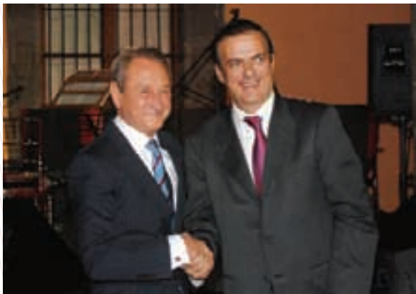
Bertrand Delanöe, alcalde de París y presidente de CGLU 2004-2010

Chicago: la ciudad de Chicago y la Ciudad de México firmaron en 1991 una Declaración Conjunta de Ciudades Amigas para trabajar conjuntamente en beneficio de sus ciudadanos. En abril de 2010, durante la visita del Jefe de Gobierno a Chicago para participar en el Richard J. Daley Global Cities Forum, esta Declaración se transformó en hermanamiento. El Jefe de Gobierno y el entonces alcalde de Chicago, Richard M. Daley, convinieron así en la necesidad de desarrollar aún más la amistad entre sus ciudades mediante cooperación recíproca en educación, salud, tecnología, desarrollo económico, artes, cultura, transporte, seguridad pública y desarrollo ambiental y urbano. Cabe mencionar que la segunda Casa de la Ciudad de México fue inaugurada en Chicago en 2008. En junio de 2011, la Ciudad de México participó en la Feria de Salud organizada por la alcaldía de Chicago en mayo de 2011, así como en el Festival de Ciudades Hermanas de Chicago, que se realizó en agosto del mismo año.