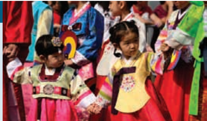
Detalle del desfile inaugural de la Feria de las Culturas

que ofrecieron una amplia oferta de actividades artísticas, culturales, muestras gastronómicas y artesanales a los ciudadanos y los turistas, además de exposiciones, muestras de cine, conferencias, talleres y recitales, entre otras.