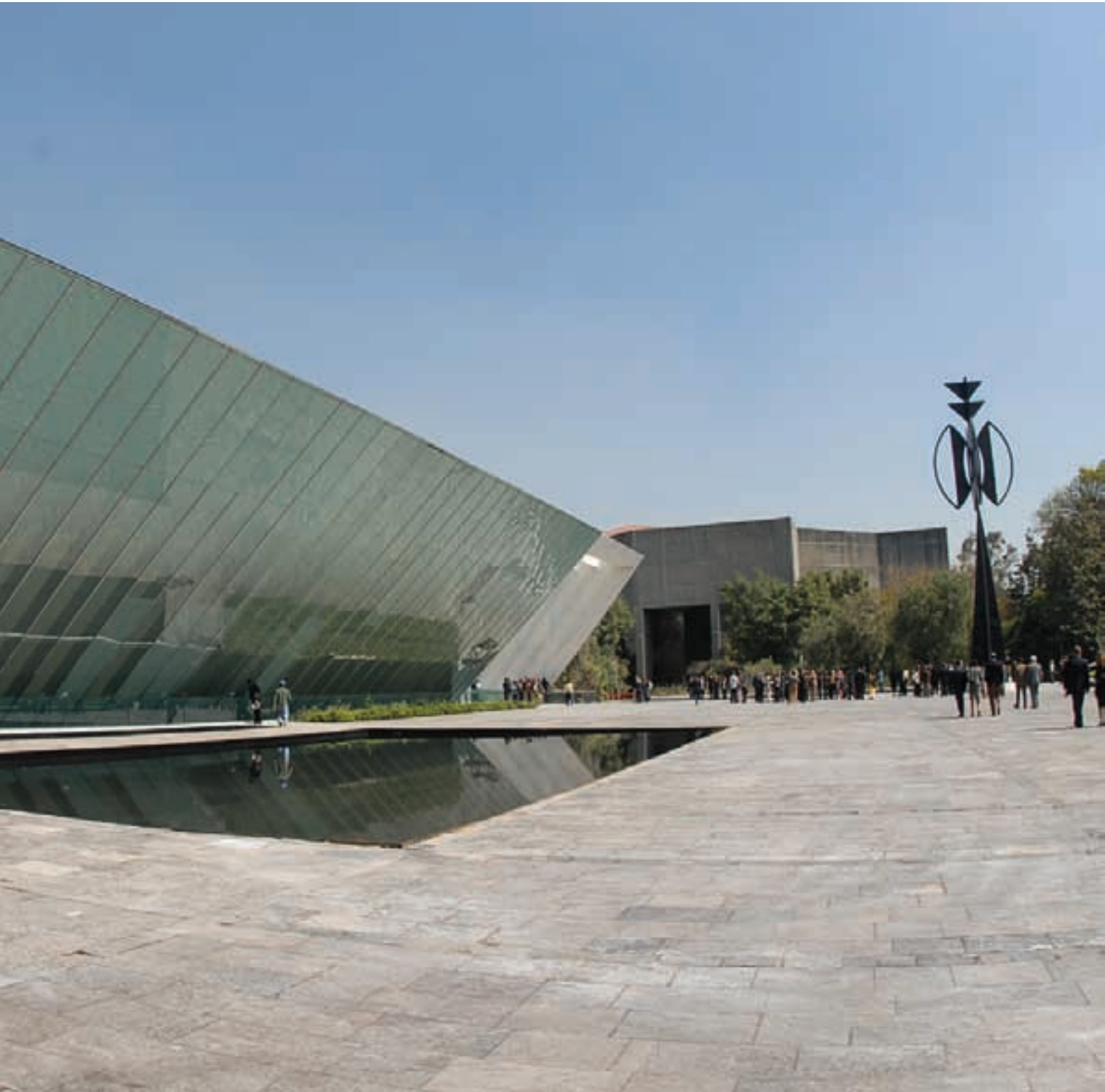
Museo Universitario de Arte Contemporáneo, UNAM