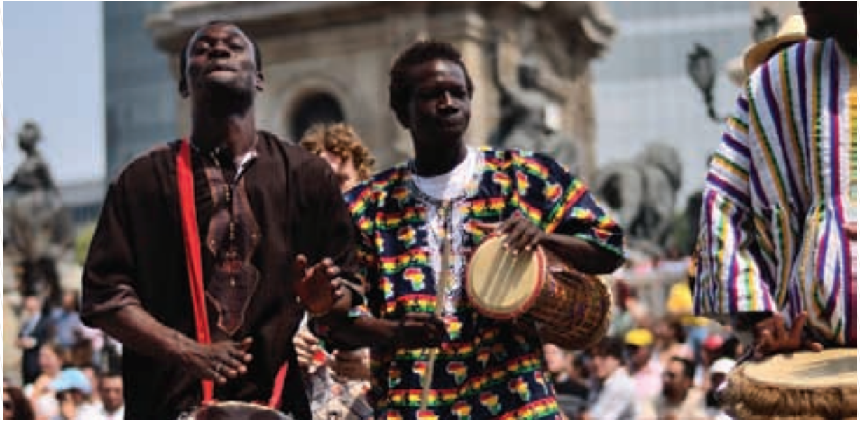
Diversidad étnica y cultural en la Ciudad de México

grupos artísticos, se proyectaron 45 filmes y se organizó el desfile de los Pueblos y Comunidades Indígenas. El evento contó con una asistencia de más de 5 mil personas.