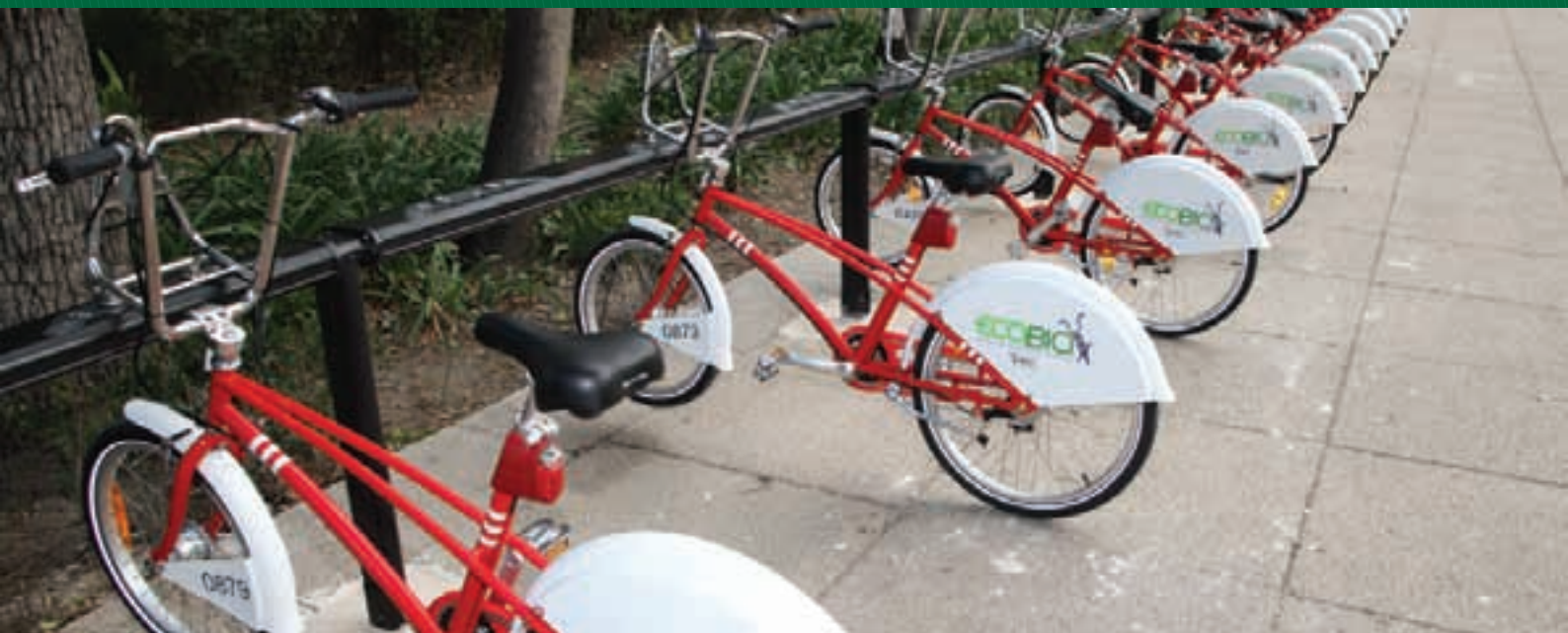
Sistema de transporte individual: Ecobici

► De 2006 a 2011, el Gobierno de la Ciudad de México ha encontrado provechosos socios y aliados internacionales que han apoyado, impulsado o reconocido las estrategias locales en temas ambientales, eficiencia energética, movilidad, transporte sustentable y recuperación de espacios públicos. Los proyectos de cooperación y apoyo técnico han sido numerosos. A continuación se presentan los más destacados.