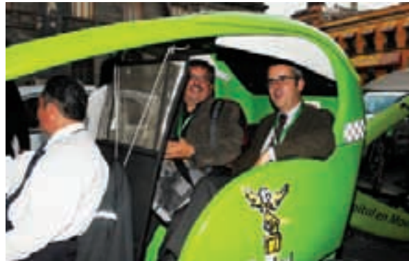
Congresistas catalanes transportándose en bicitaxi