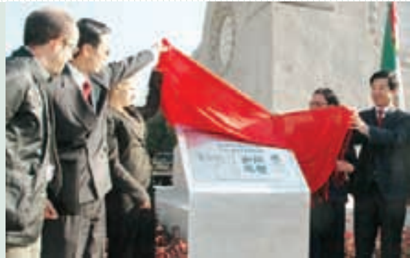
Rehabilitación del reloj chino en la glorieta de Bucareli

Lograr una ciudad más sustentable implica también generar espacios públicos en donde peatones, ciclistas y ciudadanos de todas las edades y estratos sociales puedan convivir y disfrutar de sus monumentos, parques y plazas de manera armónica.