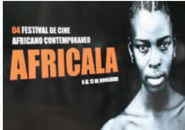
El festival de cine africano contemporáneo, otro evento cultural que se consolida en la capital del país

En 2007, la Ciudad de México acaparó la atención artística del mundo cuando el fotógrafo estadounidense Spencer Tunick fotografió en el Zócalo a más de 20 mil personas desnudas, rompiendo su propio récord mundial. En 2008, el fotógrafo canadiense Gregory Col-