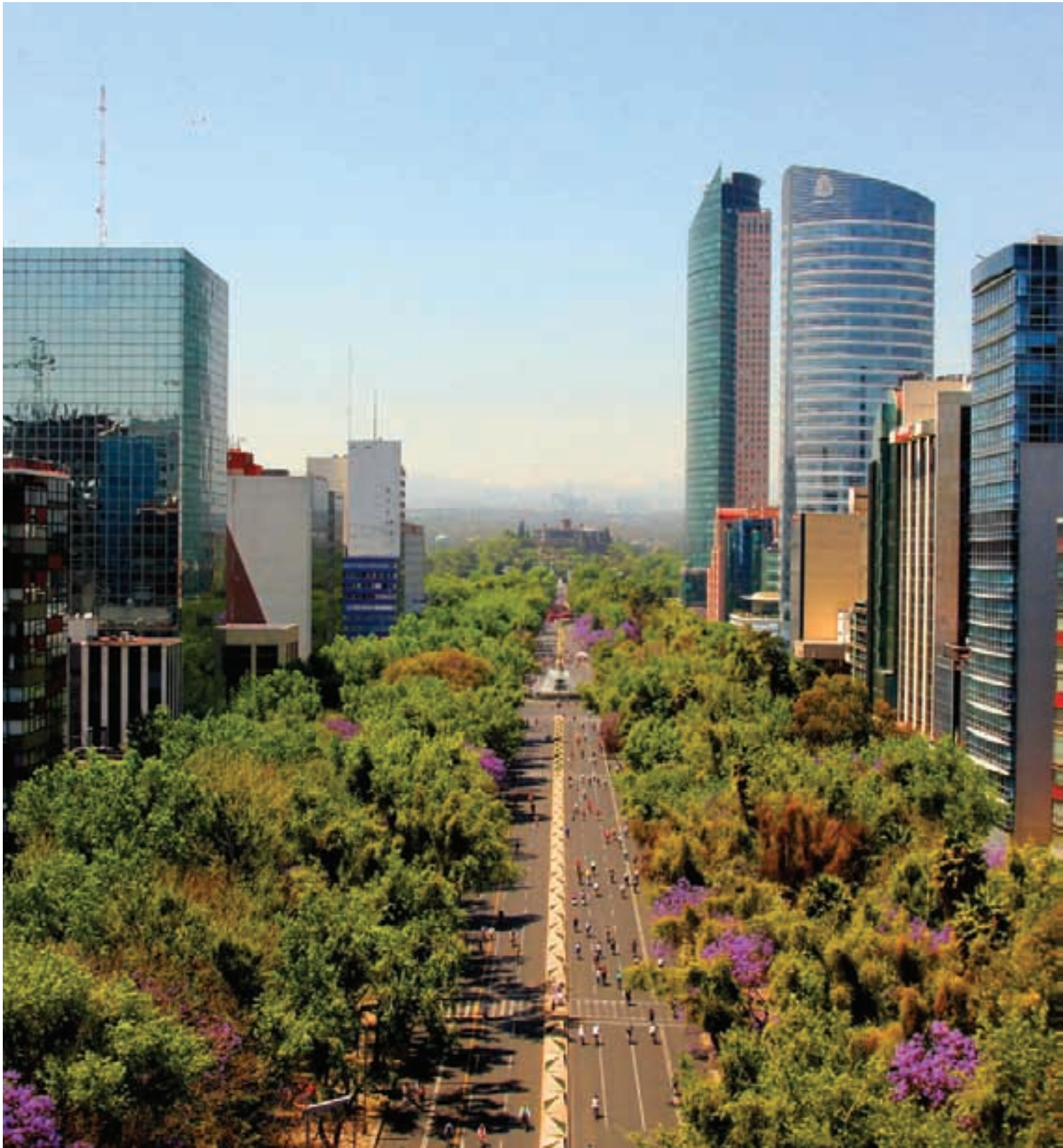
Ciclotón dominical sobre Paseo de la Reforma