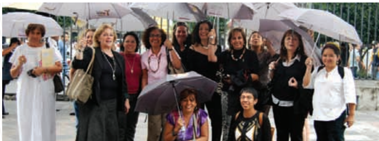
Encuentro Internacional de Ciudades Seguras para Mujeres, 2008

FEM, región Cono Sur, y representantes de Amnistía Internacional, la Red Mujer y Hábitat, el Centro de la Mujer Peruana, “Flora Tristán” y de la Alcaldía Mayor de Bogotá.