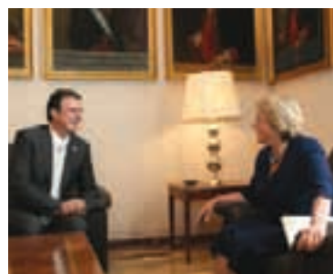
Michelle Bachelet, presidenta de Chile