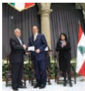
Michel Sleiman, presidente de Líbano