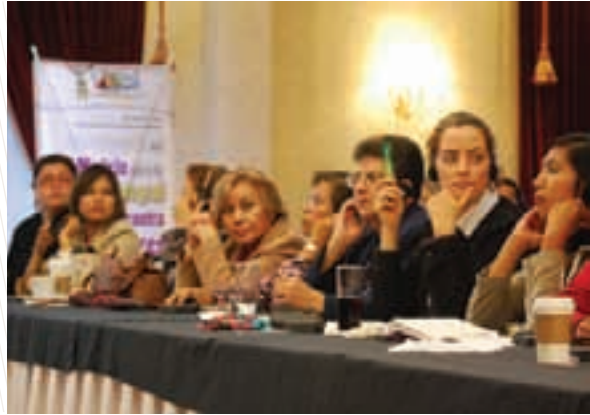
Especialistas latinoamericanas debatiendo sobre el modelo de atención integral contra la violencia hacia las mujeres, 2010

Esta decisión fue reconocida en 2009 con el Premio Género y Justicia al Descubierto del Women's Link Worldwide, otorgado a aquellas decisiones judiciales