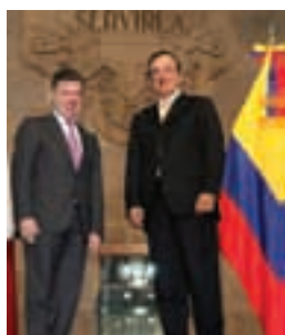
Juan Manuel Santos, presidente de Colombia