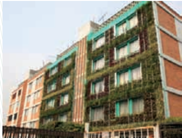
Muros verdes del programa de vivienda sustentable

labor. Tan sólo en el sector de transporte, la reducción ha sido de 4 millones 850 mil toneladas de bióxido de carbono.