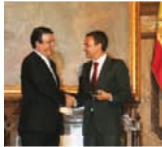
José Rodríguez Zapatero, presidente de España