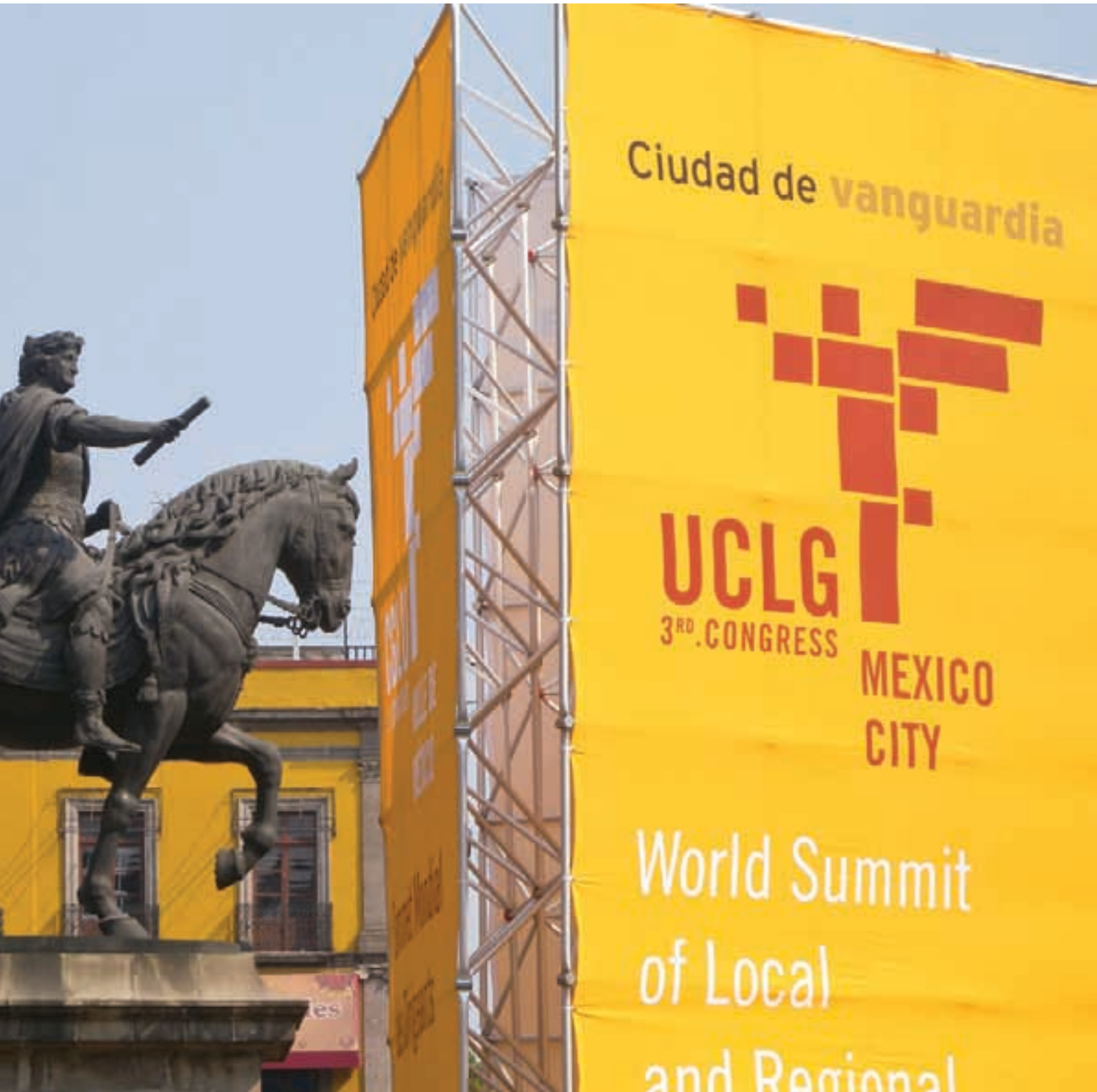
Escultura de Carlos IV de España, frente al Palacio de Minería, sede de la Cumbre