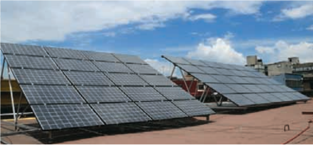
Aprovechamiento de energía solar en edificios del Gobierno de la Ciudad de México

En septiembre 2010, el Sistema de Administración Ambiental publicó el Manual para la evaluación del desempeño en manejo de residuos sólidos y en junio de 2011 el Manual para la evaluación del desempeño en la adquisición y consumo de materiales de oficina , ambos con el apoyo técnico de US-AID.