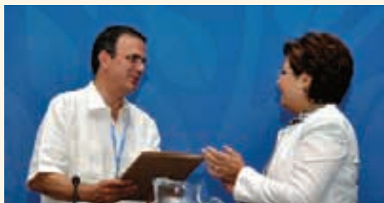
En nombre de los alcaldes del mundo, el Jefe de Gobierno entrega el Pacto de la Ciudad de México a la Canciller Patricia Espinosa, presidenta de la COP 16

Casaubon asistió a la COP 16 y expuso la posición de los gobiernos locales en una sesión plenaria oficial e hizo entrega del Pacto de la Ciudad de México a la presidenta de la Conferencia: la secretaria de Relaciones Exteriores de México, Patricia Espinosa Cantellano.