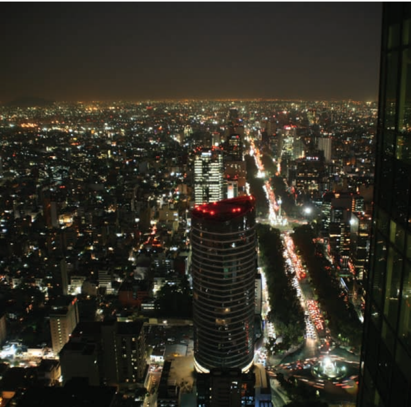
Vista nocturna de Paseo de la Reforma