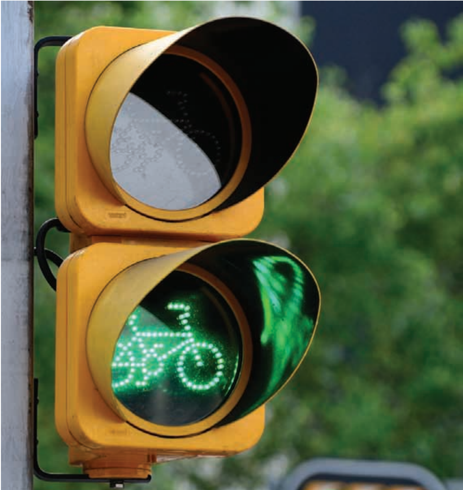
Ciclovía modelo, Paseo de la Reforma