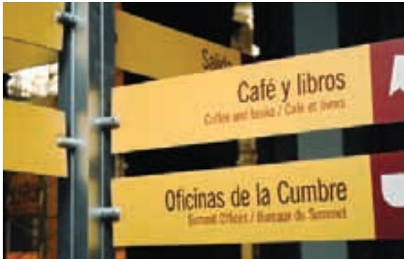
Detalle, oficinas de la Cumbre