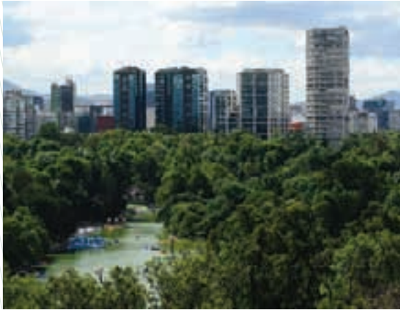
El Lago de Chapultepec