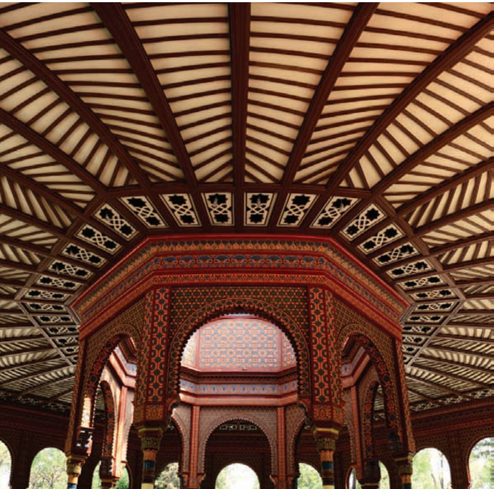
Detalle del techo del Kiosko Morisco, Santa María la Ribera