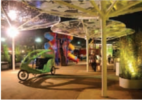
Aspecto de la Expo Ciudad de México, Ciudad de Vanguardia