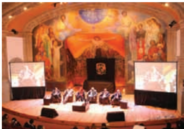
Una de las sesiones del Congreso, en el majestuoso Anfiteatro "Simón Bolívar" del Antiguo Colegio de San Ildefonso

Además, la Agencia Francesa de Desarrollo (AFD) y Ciudades Unidas de Francia (CUF) organizaron un taller de intercambio de experiencias entre Francia, Colombia, Brasil y México, mientras que ONU-Hábitat y UNESCO organizaron conjuntamente un Seminario sobre Migración en las Ciudades. Paralelamente, en el marco de la Cumbre se reunió el Comité Consultivo de Autoridades Locales ante las Naciones Unidas (UNACLA), se organizó la reunión de Presidentes Municipales de México coordinada por las asociaciones mexicanas de municipios, 1 una reunión de la Red para la Estandarización Mundial de Gobiernos IWA 4-ISO, un taller para asociaciones de municipios organizado por el Instituto Francés de la Gestión Delegada (IGD), un evento sobre Mujeres Líderes y Alcaldesas organizado por la Asamblea Legislativa del Distrito Federal (ALDF), y una reunión de la Federación Latinoamericana de Ciudades, Municipios y Asociaciones (FLACMA), entre otros.