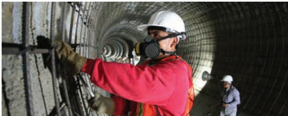
Construcción de la Línea 12 del Metro

agrupa a los 12 Metros más importantes del mundo: Berlín-BVG, Hong Kong-MTR, London Underground Ltd., Metro de Madrid, STC Ciudad de México, Moscow-MoM, Metro París (RATP) y París-RER, New York City Transit, Metro de Santiago, São Paulo-MSP y Shanghai-SMOC.