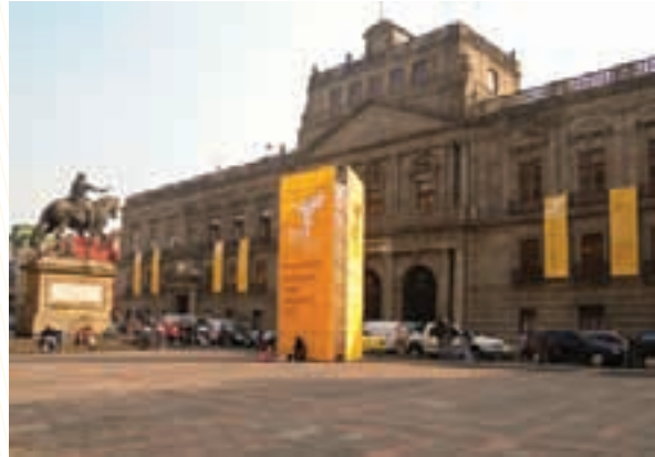
Palacio de Minería, sede de la Cumbre