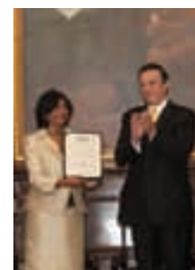
Navi Pillay, Alta Comisionada de ONU-Derechos Humanos