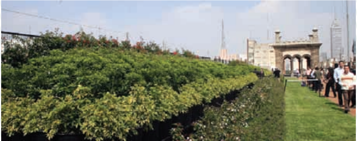
Programa de azoteas verdes: terraza del Antiguo Palacio del Ayuntamiento