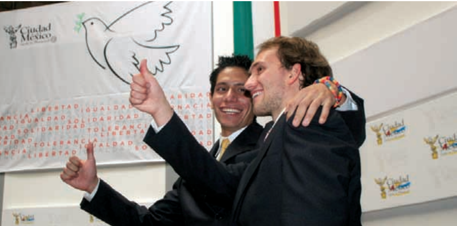
Celebración del primer matrimonio entre personas del mismo sexo en el antiguo Palacio del Ayuntamiento, Ciudad de México, marzo 2010