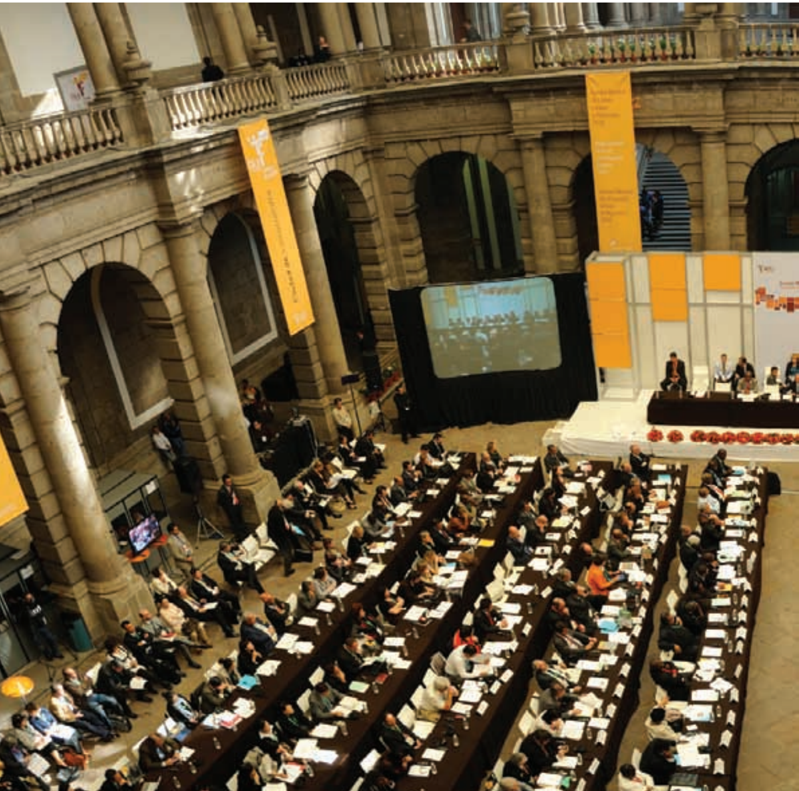
Sesión del Consejo Mundial de CGLU en el Palacio de Minería, 20 de noviembre de 2010