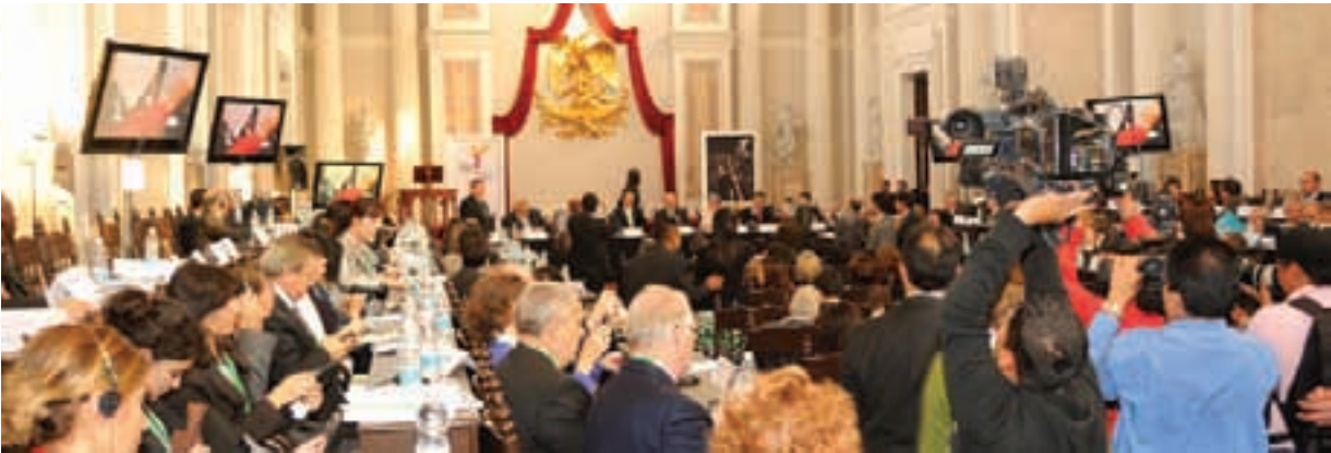
Reunión del Bureau Ejecutivo de CGLU en el solemne Salón de Actos del Palacio de Minería

en todo el mundo. En el documento se incluyen recomendaciones concretas para las ciudades, los gobiernos nacionales y las instituciones internacionales. La iniciativa es el fruto del trabajo de la Comisión CGLU sobre Planificación Estratégica Urbana, liderada por la Intendencia Municipal de Rosario en Argentina.