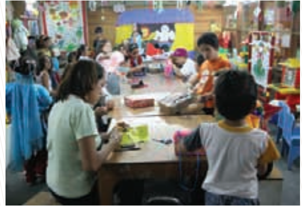
Los FAROS, Fábricas de Artes y Oficios, en barrios populares de la Ciudad México, ejemplo mundial de política local de inclusión social

crear empleo, capacitar a los jóvenes y sus familias en oficios productivos, reconstituyendo el tejido social.