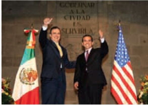
Marcelo Ebrard Casaubon con Antonio Villaraigosa, Alcalde de Los Ángeles