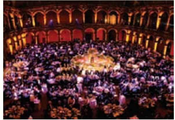
Cena de gala en el Ex Convento de las Vizcaínas