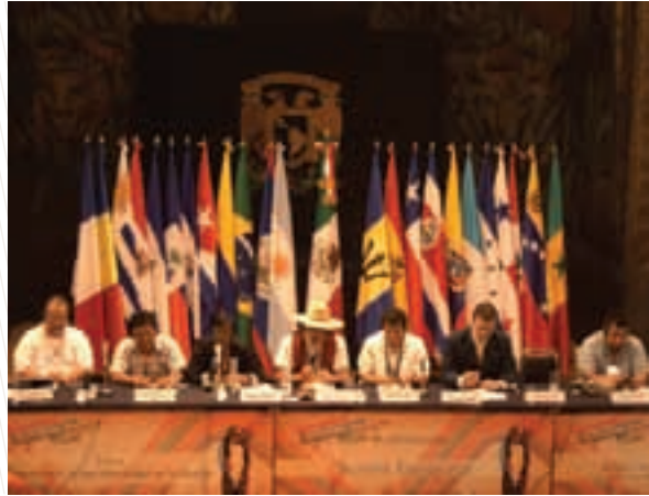
Encuentro de pueblos indígenas originarios y afrodescendientes de América Latina y el Caribe, 2010

Desde siempre, la Ciudad de México ha sido un lugar hospitalario con los migrantes, asilados políticos y visitantes extranjeros. Con el propósito de conocer las historias de exiliados que llegaron a la Ciudad de México durante el siglo XX procedentes de todas partes del mundo, la Casa Refugio Citlaltépetl y la Comisión para los Festejos del Bicentenario de la Independencia Mexicana de la Ciudad de México produjeron una colección de 25 carteles en español, inglés y francés, y un catálogo que narra la vida de personajes perseguidos, exilios conscientes o forzados, y una ciudad dispuesta a recibirlos.