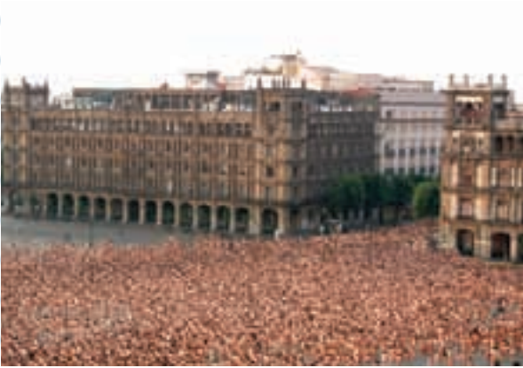
Más de 20 mil personas desnudas fueron fotografiadas por Spencer Tunick en el Zócalo de la Ciudad de México

culturales para los usuarios de manera gratuita. Desde 2009, las autoridades del Metro y la Coordinación General de Relaciones Internacionales de la Ciudad de México, en colaboración con diversas embajadas de países amigos, han hecho del Metro una vitrina privilegiada de exposiciones encaminadas a difundir la cultura, la historia y la vida cotidiana de distintas naciones y ciudades amigas de la Ciudad de México. Han participado en esta iniciativa las Embajadas de Alemania, China, Corea del Sur, Cuba, Ecuador, Francia, Guatemala, Países Bajos, Israel, Japón, Reino Unido, República Checa, Venezuela.