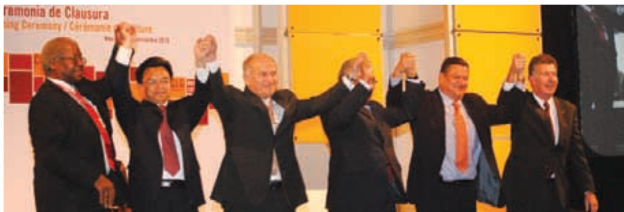
La nueva Presidencia de CGLU para el periodo 2010-2013