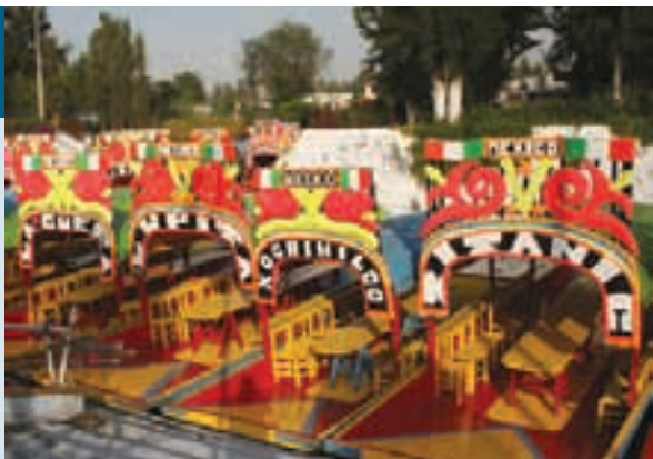
Trajineras en los canales de Xochimilco