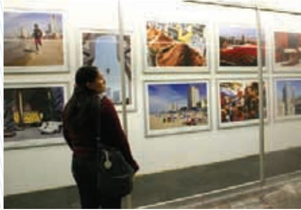
La cultura de más de 15 países se ha exhibido en el Metro de la Ciudad de México