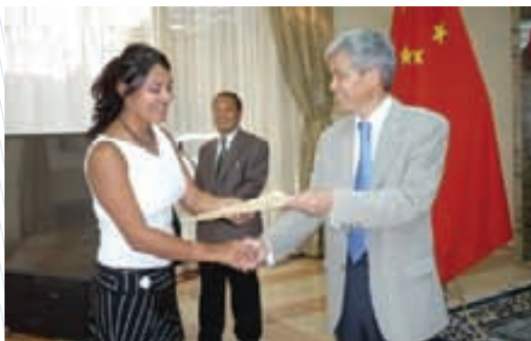
Becarios de la Ciudad de México reciben apoyos para realizar estancias de investigación en Beijing, China