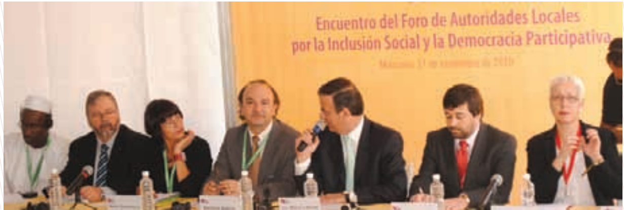
La Red FAL nace en el Foro Social Mundial de Porto Alegre, Brasil, y agrupa alcaldes progresistas del mundo entero