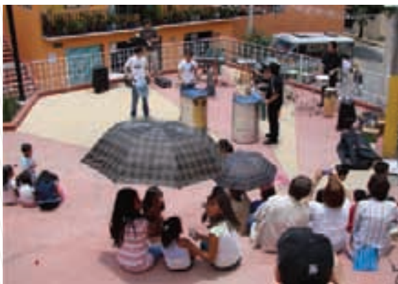
Plan comunitario del pueblo de Santa Fe