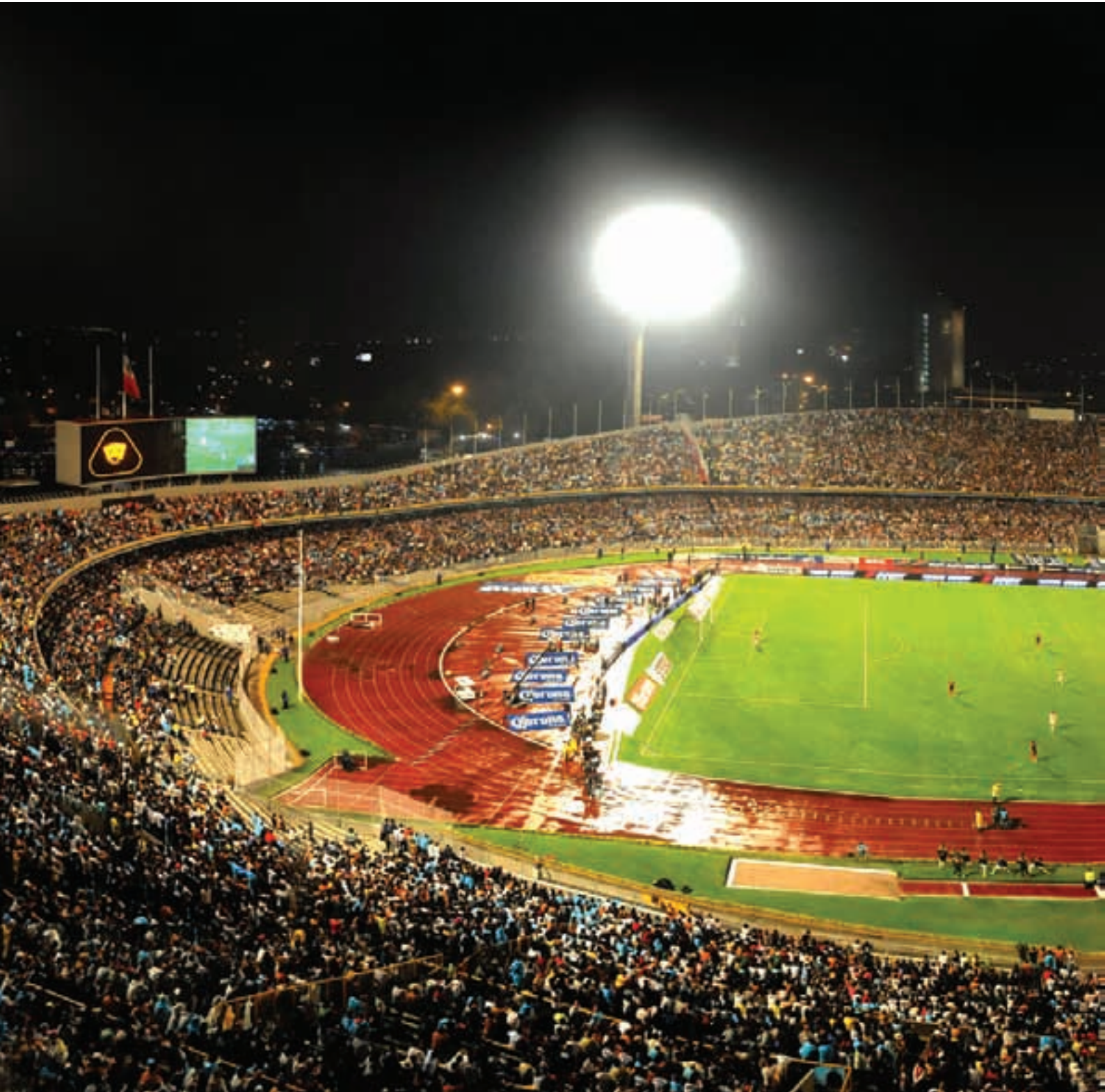
Estadio Olímpico Universitario, UNAM