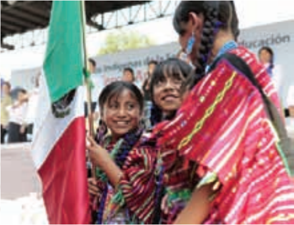
Toda ciudad global es una ciudad intercultural