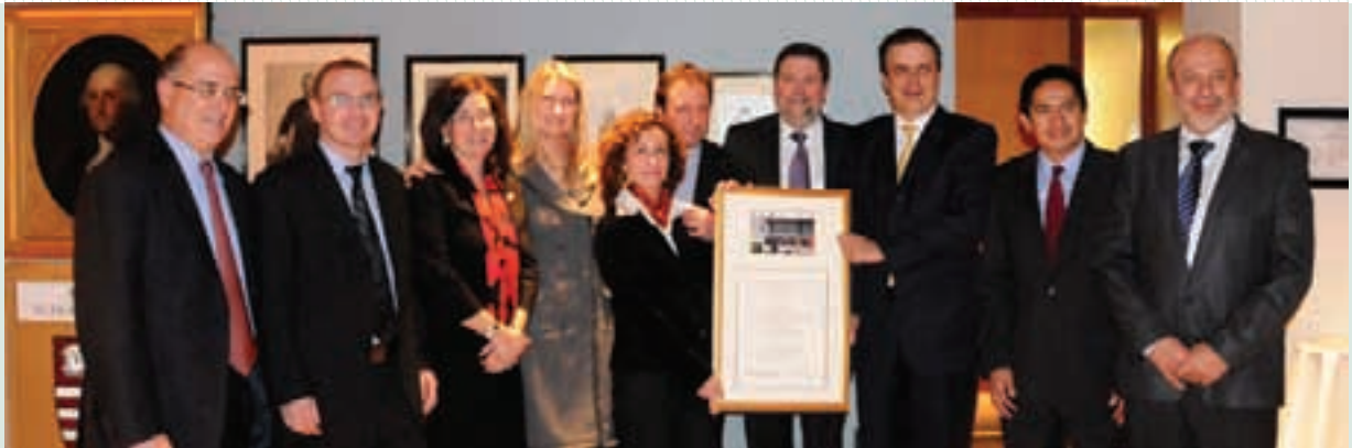
El Jefe de Gobierno recibe el Premio Roy Family 2009 de la Universidad de Harvard por el Metrobús

siones: Euro III, IV y V, así como diesel de Ultra Bajo Azufre (UBA), lo cual, aunado al retiro de más de 800 microbuses altamente contaminantes e inseguros, ha generado una reducción anual de más de 100 mil toneladas de GEI. Esta reducción se ha comercializado en el Mercado Internacional de Bonos de Carbono, lo que ha permitido obtener recursos internacionales para seguir ampliando la cobertura del servicio.