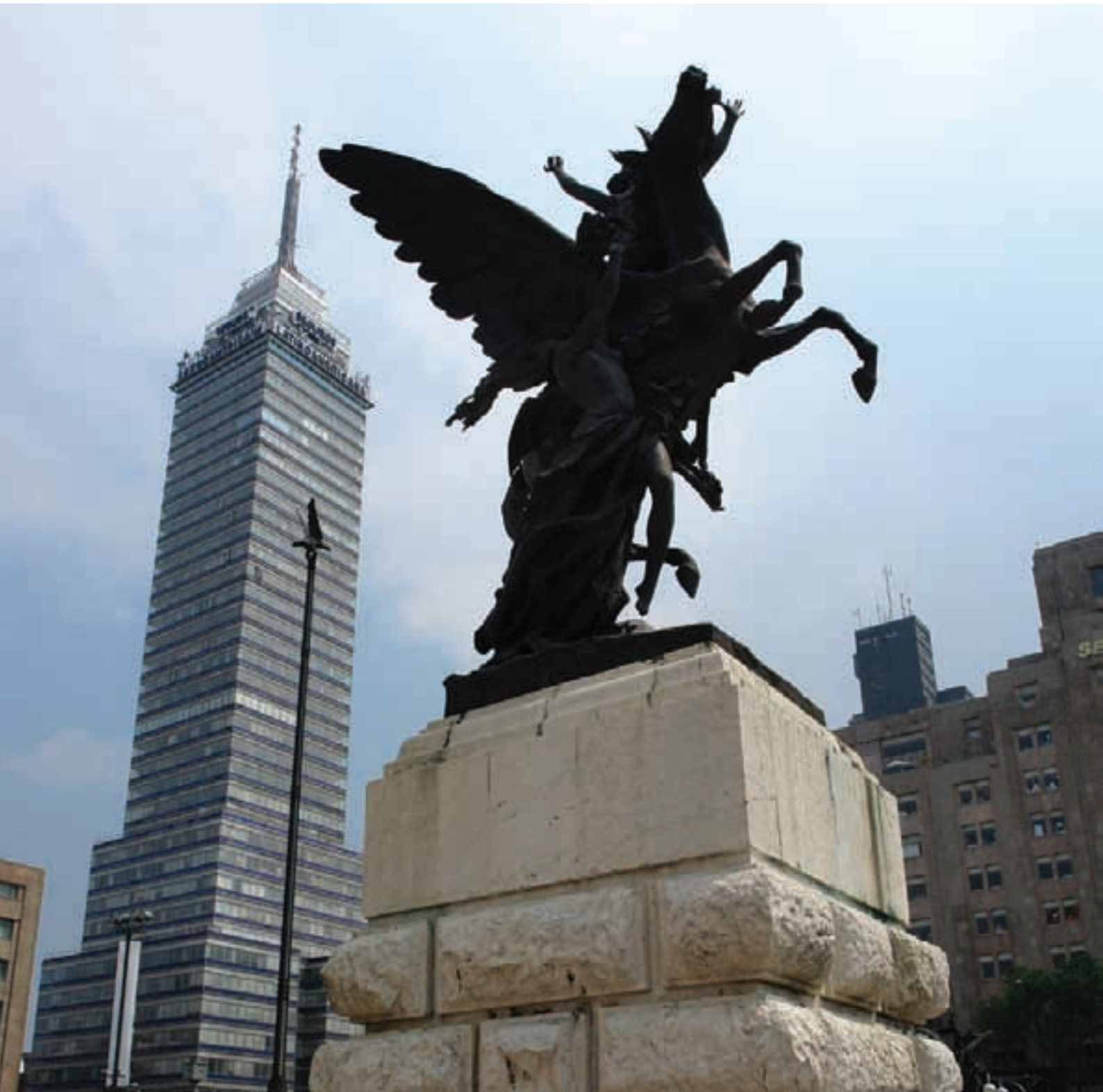
Explanada del Palacio de Bellas Artes. Al fondo, la Torre Latinoamericana