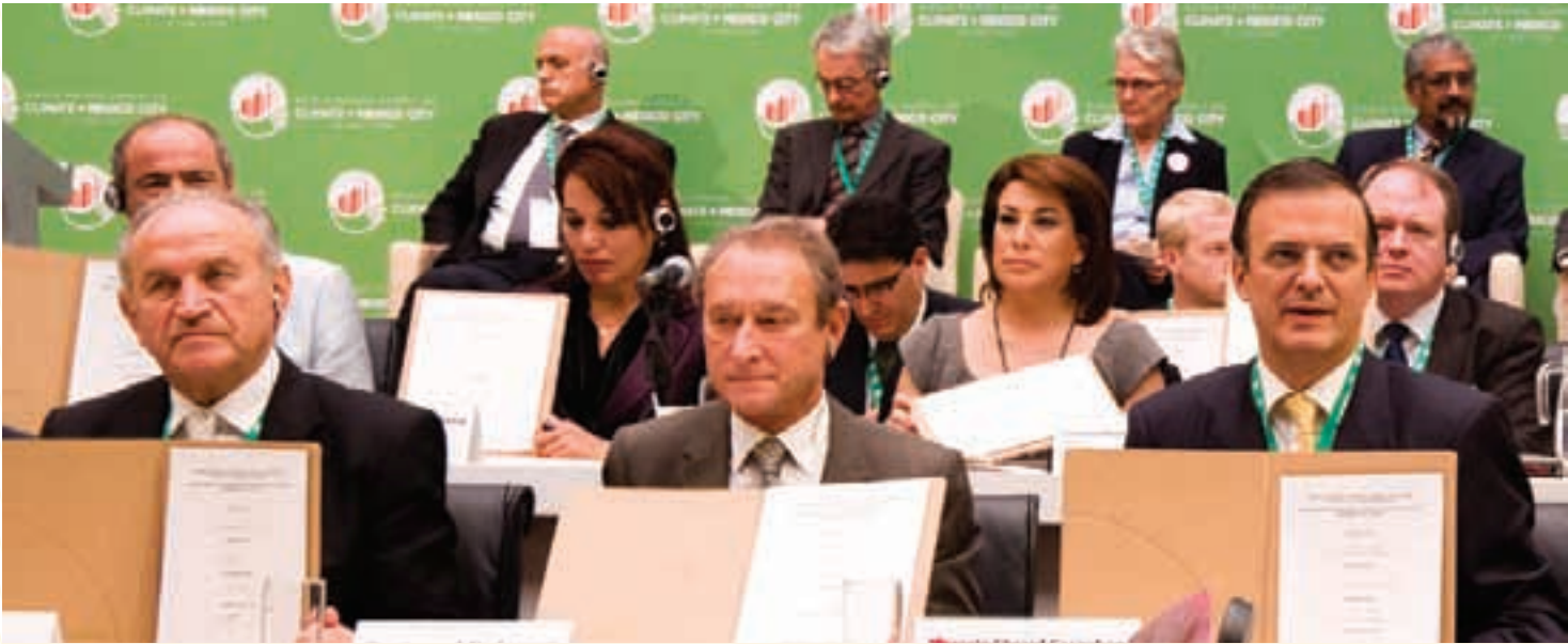
El Jefe de Gobierno de la Ciudad de México, Marcelo Ebrard Casaubon, flanqueado por los alcaldes de Los Ángeles, París, Estambul y otros más en la firma del Pacto de la Ciudad de México contra el calentamiento global