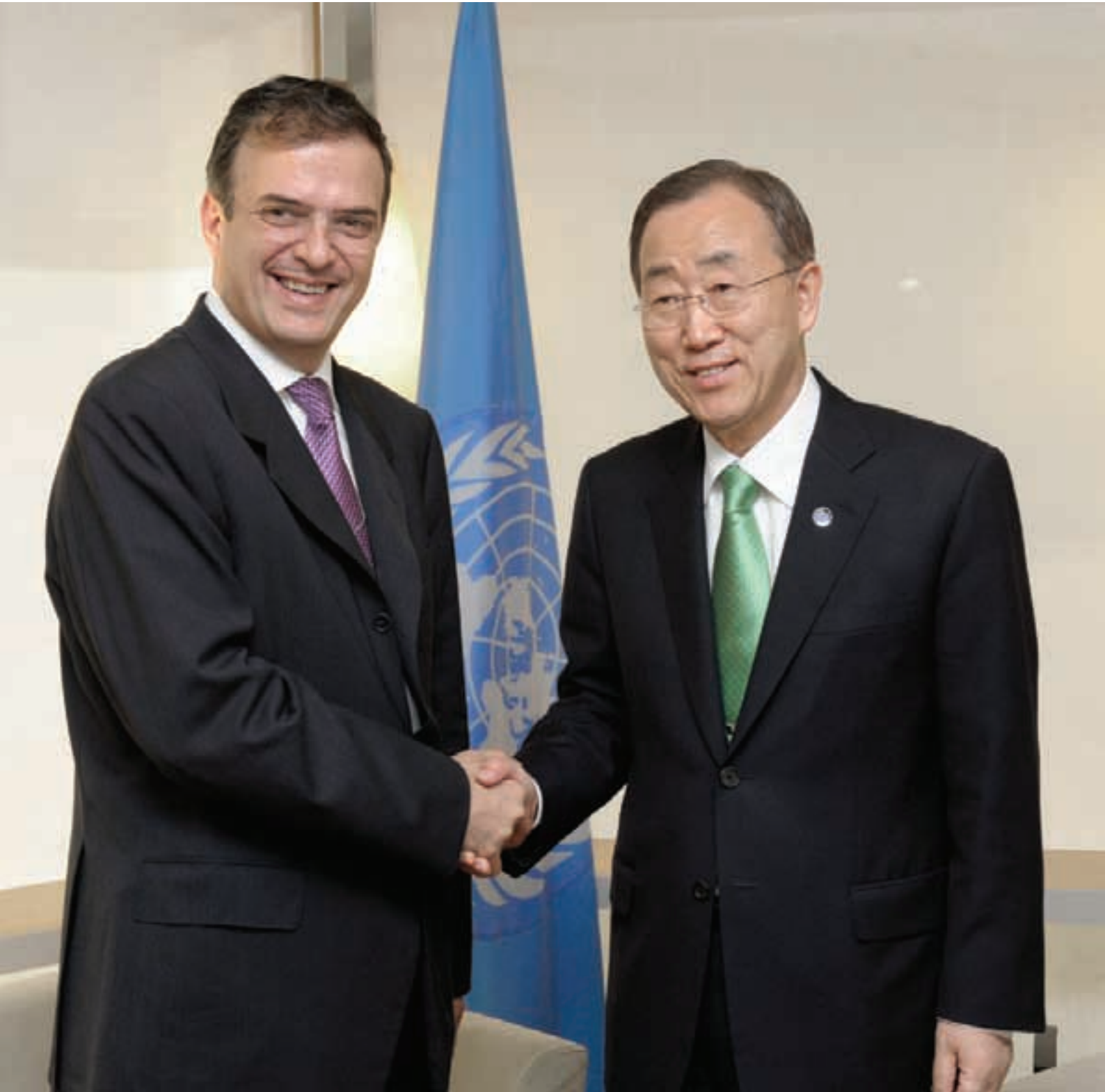
El Jefe de Gobierno de la Ciudad de México con Ban Ki-moon, secretario general de la Organización de las Naciones Unidas (ONU), 2011