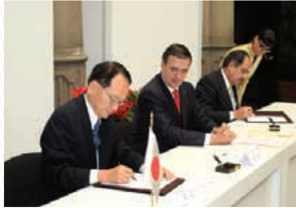
Cooperación con el gobierno de Japón para mejorar infraestructura sanitaria en escuelas de la Ciudad de México

En noviembre 2009, el Gobierno de Japón, a través de su Embajada en México, firmó un Convenio de Donación por 400 mil dólares con la Ciudad de México