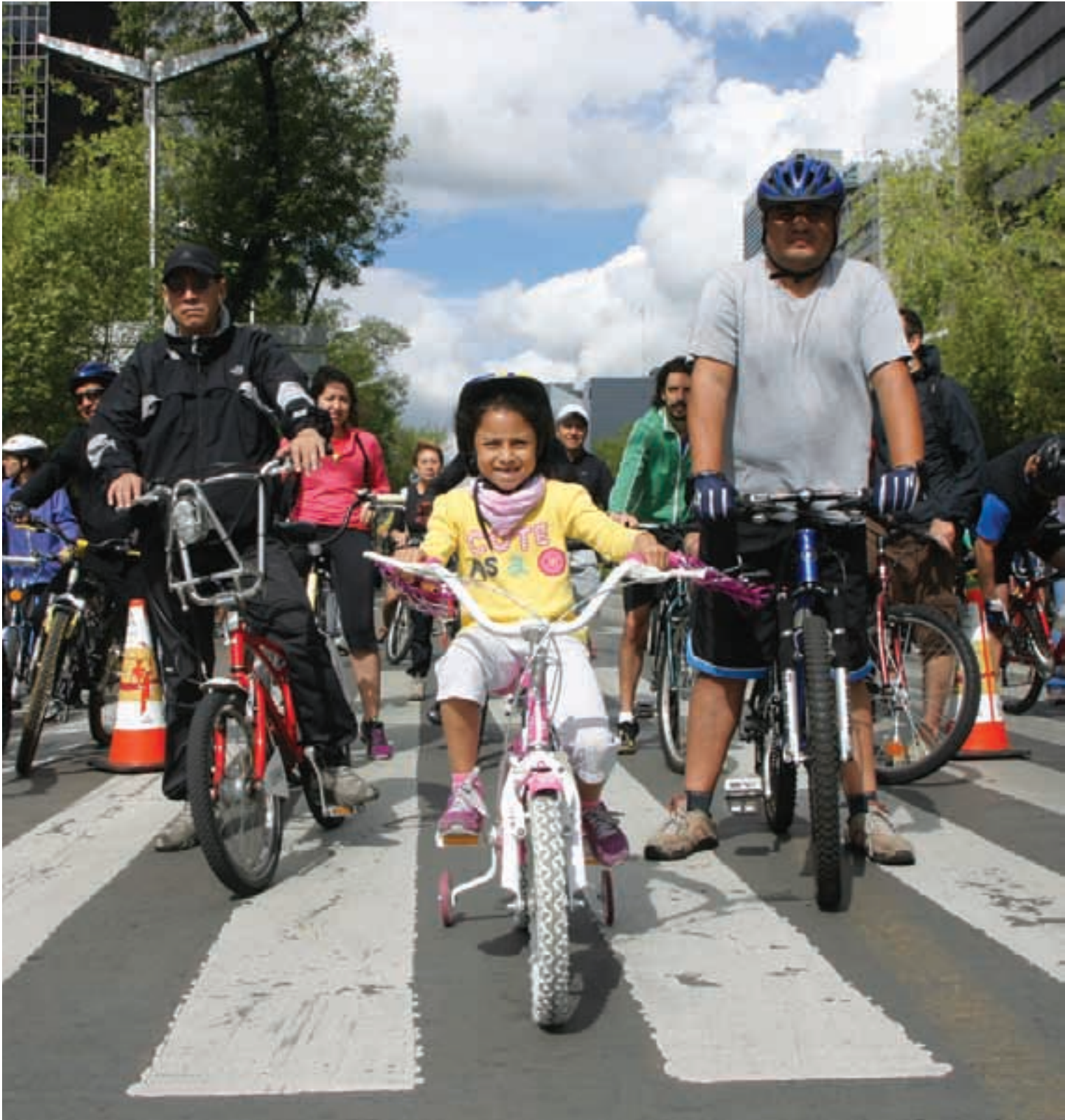
Cerca de cuatro millones de ciclistas han participado desde 2006 en los paseos dominicales