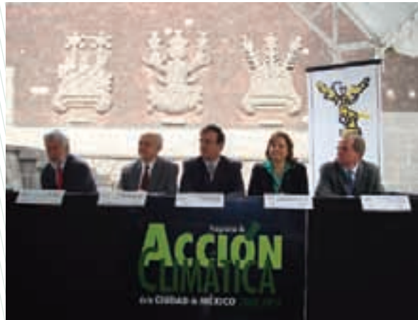
El Jefe de Gobierno presenta el Programa de Acción Climática

Para el Gobierno de la Ciudad de México, el cambio climático es una realidad que pone en riesgo la vida de miles de personas alrededor del mundo y que puede traer consigo enormes costos sociales, ambientales y económicos. Ante esta circunstancia es indispensable