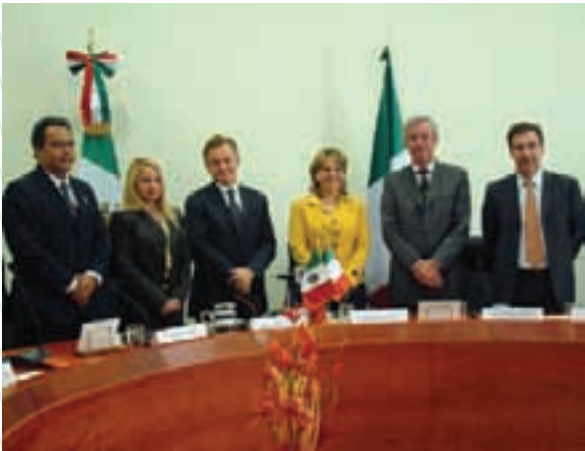
Firma de convenio ambiental con el gobierno de Italia