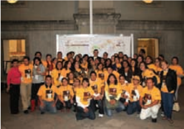
Voluntarios de la UACM: las Amigas y los Amigos de CGLU