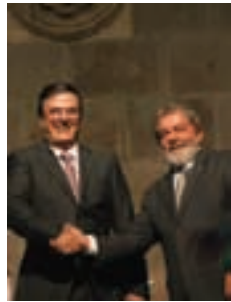
Luiz Inácio Lula da Silva, presidente de Brasil

La Ciudad de México ha declarado como Huésped Distinguido, entregado la Llave de la Ciudad y la prestigiada Medalla de la Ciudad de México a personalidades destacadas de la política, la cultura, el deporte y la economía mundial.